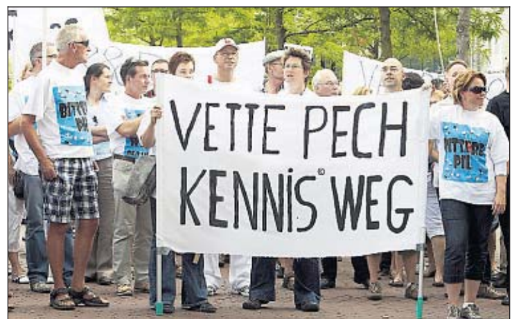
Kennis weg. Onder die noemer wordt politieke druk uitgeoefend om een onderzoekscentrum op te richten dat wat kan doen met de kennis van voormalig Organon.

Van den Heuvel reageert op het wapen van de „octrooirechtelijke dwanglicentie” dat de rijksoverheid in staat stelt ten behoeve van het „algemeen belang” een bedrijf te dwingen het